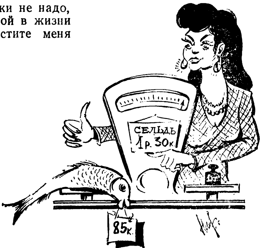
Рис. Н. Носова.

— Никакой мне выручки не надо, к селедке этой подколотной в жизни близко не подойду, отпустите меня только на волю!